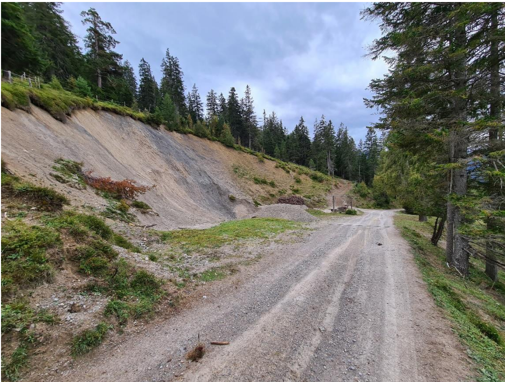
Abbildung 10: Kiesabbaustelle der Gemeinde / Vorgesehener Ausstellplatz