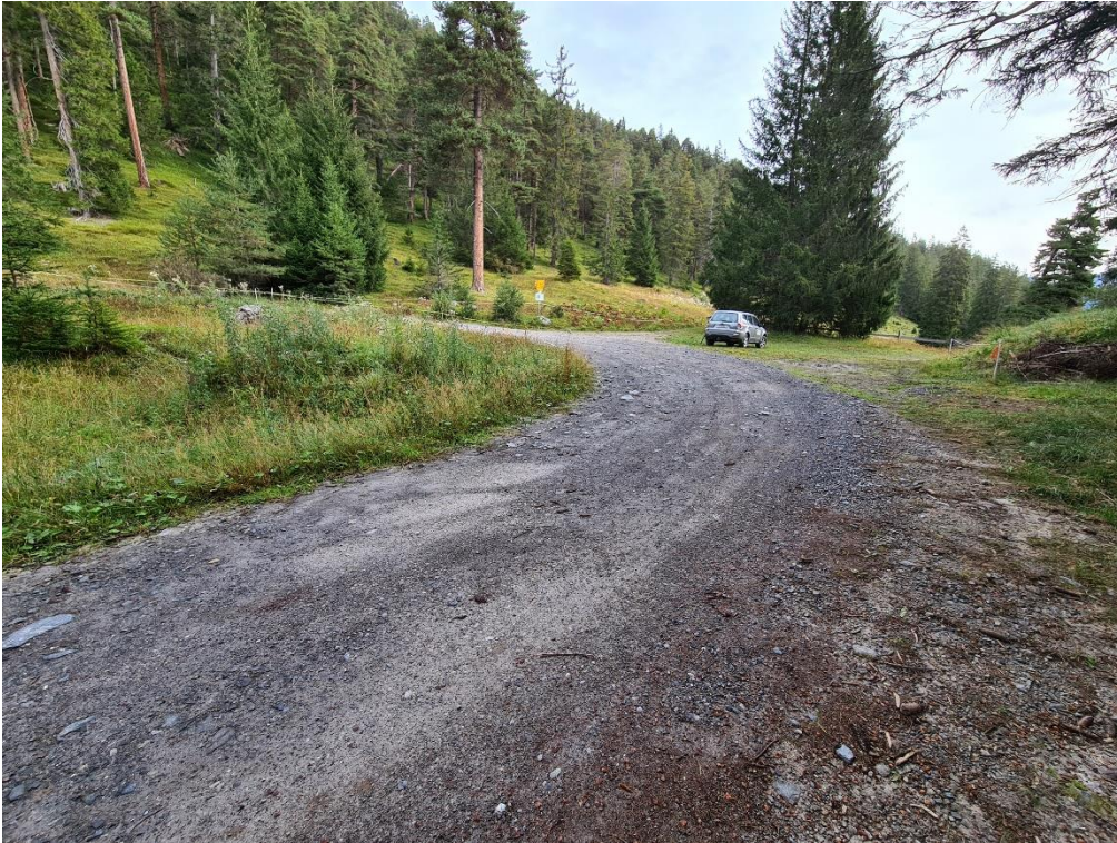
Abbildung 3: Wendeplatte 2