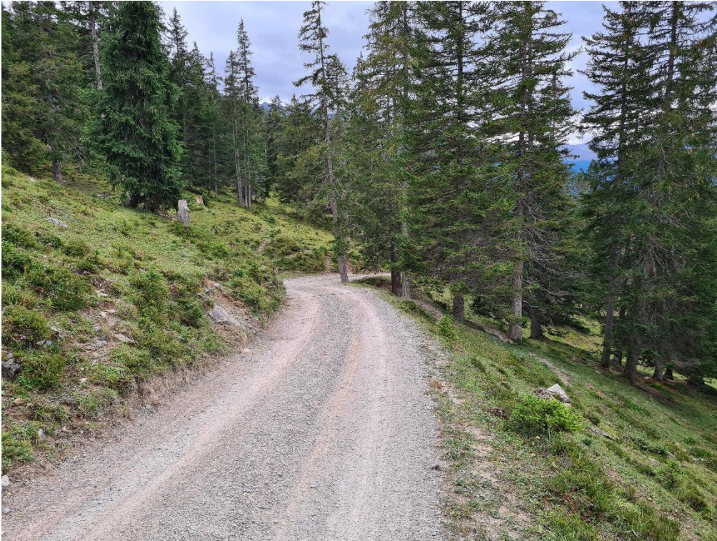
Abbildung 11: Vorgesehener Ausstellplatz bei Kurve