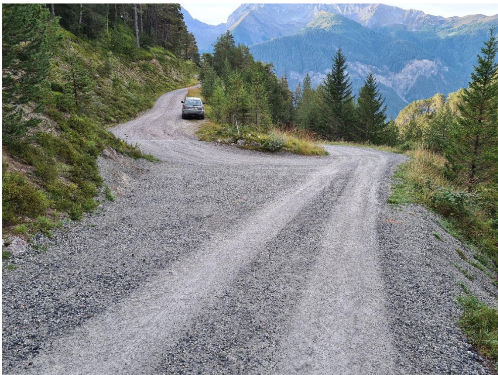
Abbildung 2: Wendeplatte 1