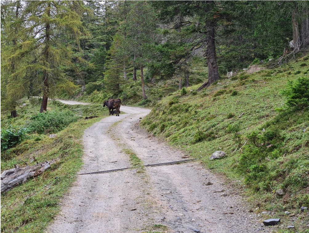
Abbildung 9: Vorgesehener Ausstellplatz