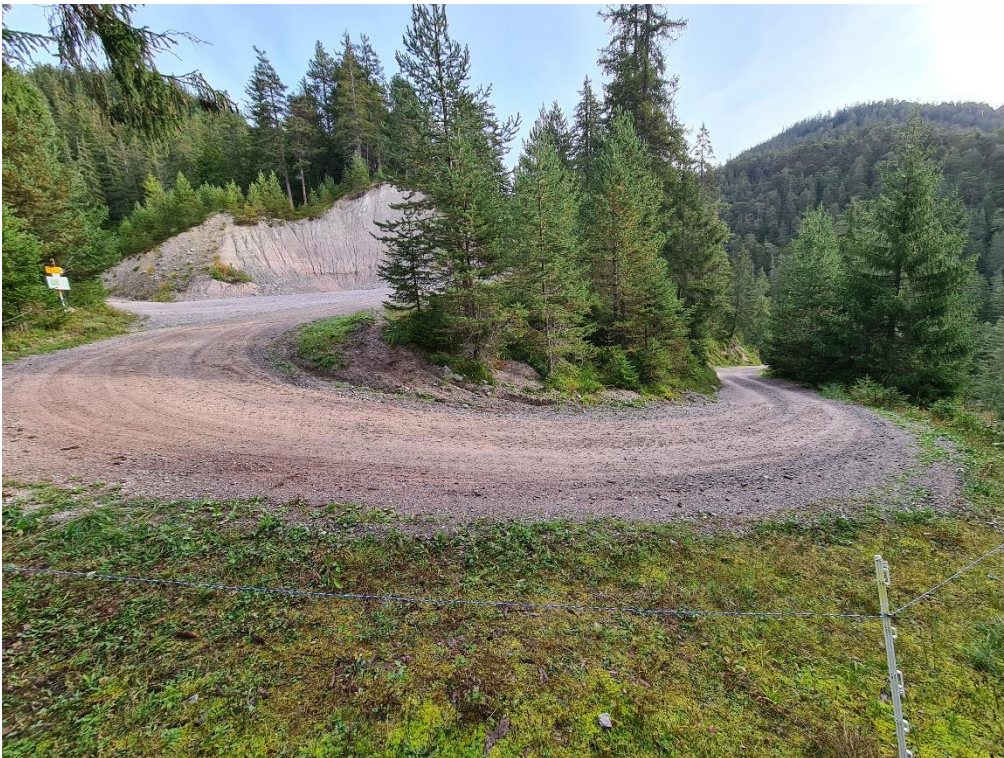
Abbildung 4: Wendeplatte 3