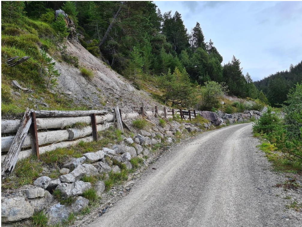
Abbildung 7: bergseitige Stützkonstruktion zw. Wendeplatte 3 und Kreuzung Pro Valtier