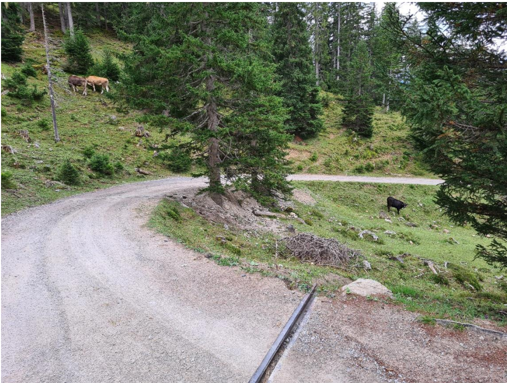
Abbildung 12: Vorgesehener Holzlagerplatz / Aufschüttung mit überschüssigem Aushubmaterial