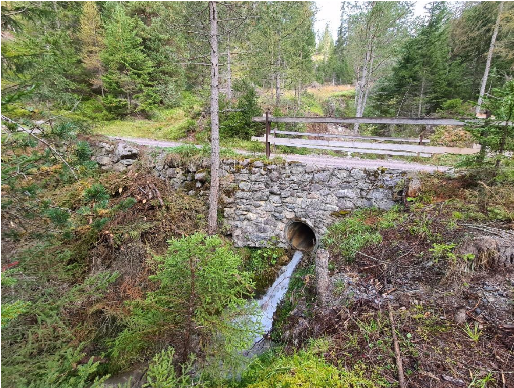
Abbildung 5: Bachquerung / Durchlass zw. Wendeplatte 3 und Kreuzung Pro Valtier