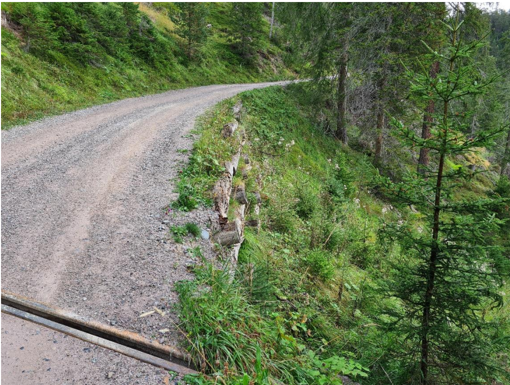
Abbildung 6: talseitiger Holzkasten zw. Wendeplatte 3 und Kreuzung Pro Valtier