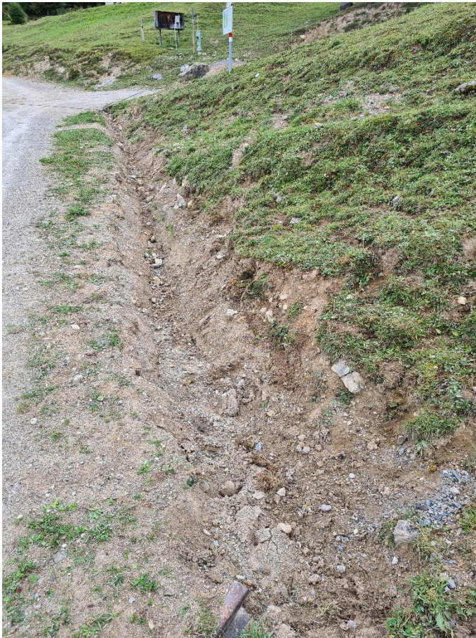
Abbildung 14: Entwässerungsgraben Kreuzung Alcas Davains