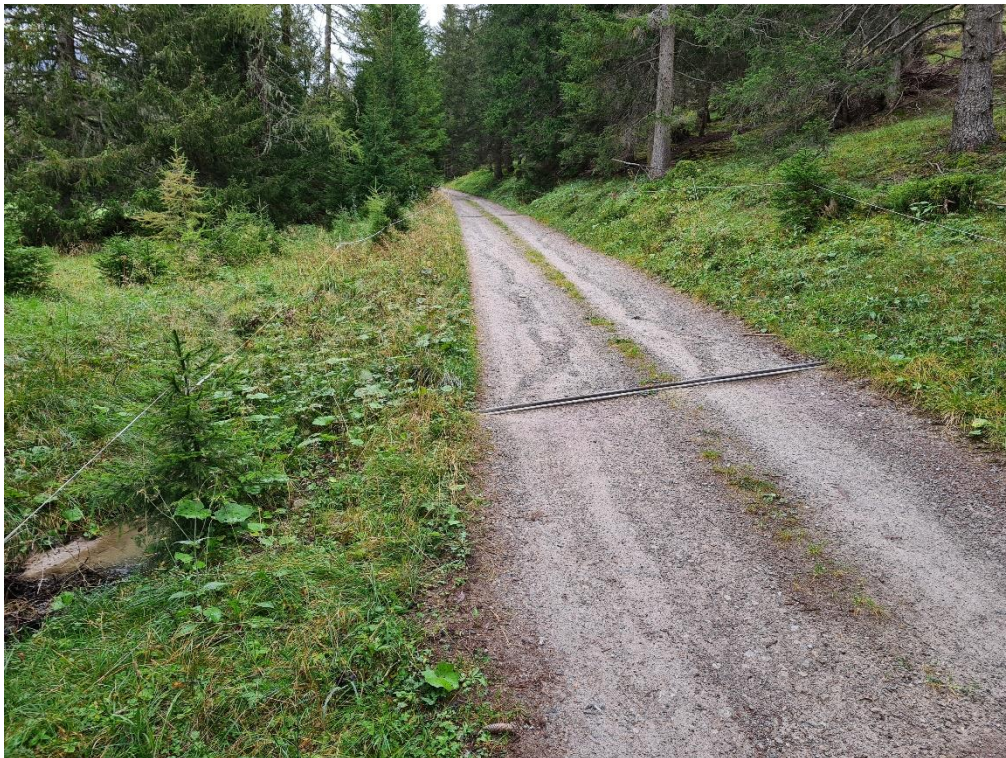
Abbildung 8: Ausbau Waldweg von Kreuzung Pro Valtier nach Kreuzung Aclas Davains