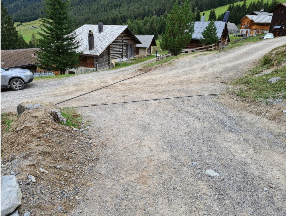
Abbildung 13: Kreuzung Aclas Davains